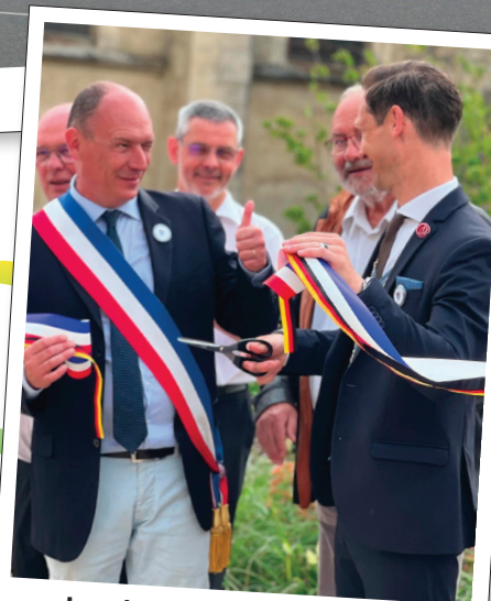
Jumelage Mangers Gerolzhofen 50 ans d'une amitié forte