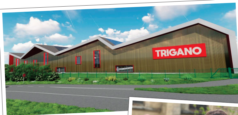
Le renouveau de Trigano