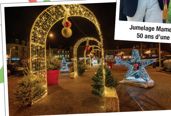
De nouvelles illuminations